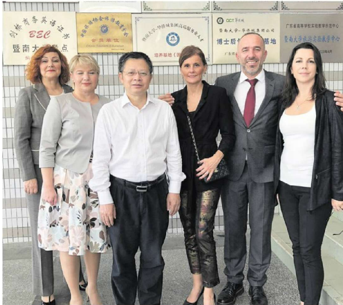
Opatijska delegacija u društvu dekana fakulteta za turizam Shenzhena

Na poziv grada Shenzhena Opatija je dobila priliku predstaviti se brojnim predstavnicima turističkih agencija i medija u kongresnom prostoru hotela »Marco Polo« u Shenzhenu uz prisutnost i podršku visokih dužnosnika gradske uprave. Unatoč činjenici da je većina Kineza čula za Marka Pola, vrlo mali broj ga veže uz našu zemlju