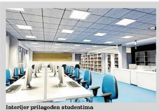
Interijer prilagođen studenima

Fakultet za menadžment u turizmu i ugostiteljstvu tražen je među studentskom populacijom, i na kadar te ustanove tražen je na tržištu rada. - Posljednje četiri godine u suradnji s gospodarstvom nagrađujemo najboljeg studenta radnim mjestom. Najbolji student dobije ugovor o radu na godinu dana, no treću godinu provedbe te akcije dogodilo se da namiko nagradu iz razloga što je prvi pet studenata na listi najboljih već imalo radno mjesto. Razvojna karijera naših studenata je ubrzana, jer počnu s poslom niže ranga, a za desetak godina nađu se na menadžerskim pozicijama, kaže prof. dr. Smolčić Jurdana. Naglasak se stavlja i na vertikalno obrazovanje pa se fakultet uključio i u projekt Regionalnih centara kompetentnosti, a budućim studentima nije atraktivan samo fakultet u Iki, već i studijski centar u Zaboku kojeg upisuju veliki broji studenata.