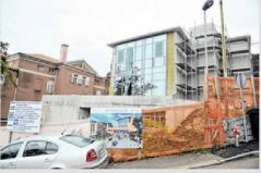
Sadašnje stanje i slika budućeg izgleda

Projekt Mini kampusu nisu samo židovi i prozori nego novi razvojni iskorak koji će otvoriti brojne aktivnosti fakulteta. Bit će to prostor ljetnih aktivnosti, predavanja, škole i stručne edukacije. Programi cjeloživotnog obrazovanja do sada su bili dislocirani zbog nedostatka prostora, što je otežavalo njihovo izvođenje, a sada će se vratiti u svoju matičnu ustanovu. - Do sada smo već imali niz upita ne samo iz Hrvatske nego i inozemstva o organizaciji ljetnih škola i seminara, tečajnih skupova, a sada ćemo napokon biti u mogućnosti organizirati takve dodatne sadržaje. Imamo i kantine Studentskog centra što će nam omogućiti organizaciju prehrane, najavljuje dekanica. Mini kampus iet neće zatvarati svoja vrata, a iako neće doprinijeti povećanju broja studenata, doprinit će povećanju broja programa i to već od iduće akademske godine.