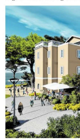
Simulacija budućeg aneksa

Sa završetkom aneksa građevinski radovi u toj ustanovi neće se okončati, jer će kretni s uređenjem postojeće zgrade u kojoj će se saklanjati prostor knvijazije pri namjeni za potrebe administrativnih službi, a od dvije učionice napraviti će se kabine za nastavnike, što je također goruća potreba Fakulteta. S preinakama u postojećoj zgradi, najavljuje dekanica, kreću se i s uređenjem akademskog godišta, odnosno tijekom Opatijskih ljeta. Sve će to doprinijeti i učenju i druženju na otvorenom, te realizaciju studentskih aktivnosti. Sve će to doprinijeti inace atraktivnosti ali jedinstvenom lokaciji fakulteta, jer u Hrvatskoj ne postoji fakultetska zgrada smještena na samoj obali mora.