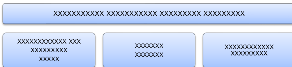
Slika 1. Naslov slike

XXXXXXXXXXXXXXXXXXXXXXXXXXXXXXXXXXXXXXXXXXXXXXXXXXXXXXXXXXXXXXXXXXXX. Vrsta i veličina slova u tekstu je Times New Roman 12; prored 1,5; bez razmaka između ulomaka; svi ulomci uvučeni za 0,5 osim prvog ulomka ispod naslova; započinje na zasebnoj stranici; stranice numerirane arapskim brojevima; tekst obostrano poravnat ( Justify ); koriste se jezične strukture — „smatra se“, „istraživanja su pokazala“, „uočeno je“, „analizirane su“; fusnote (Times New Roman 10, obostrano poravnate, prvi red teksta u fusnoti uvučen za 0,5).